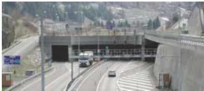
1 Nordportal des St.-Gotthard-Tunnels im Kanton Uri

Die eingesetzte Software PVSS II bietet die optimalen Voraussetzungen zur Umsetzung der anspruchsvollen Projektziele.